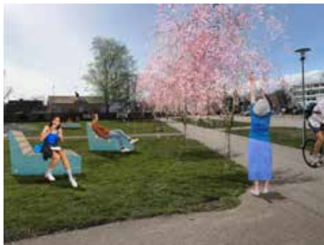
Visionsbilder för parken.