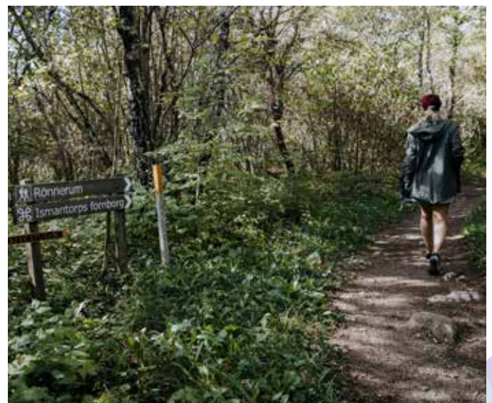
Nu rustas vandringsleden vid Hornsjön och Ismantorps borg upp.