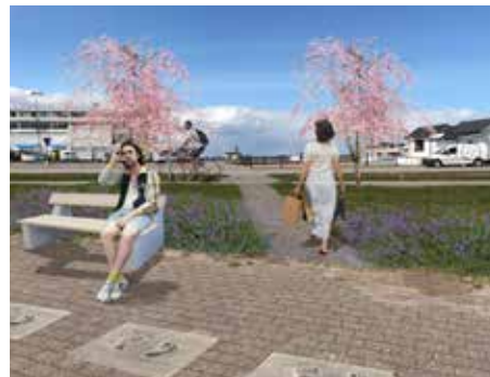
Visionsbilder för parken.