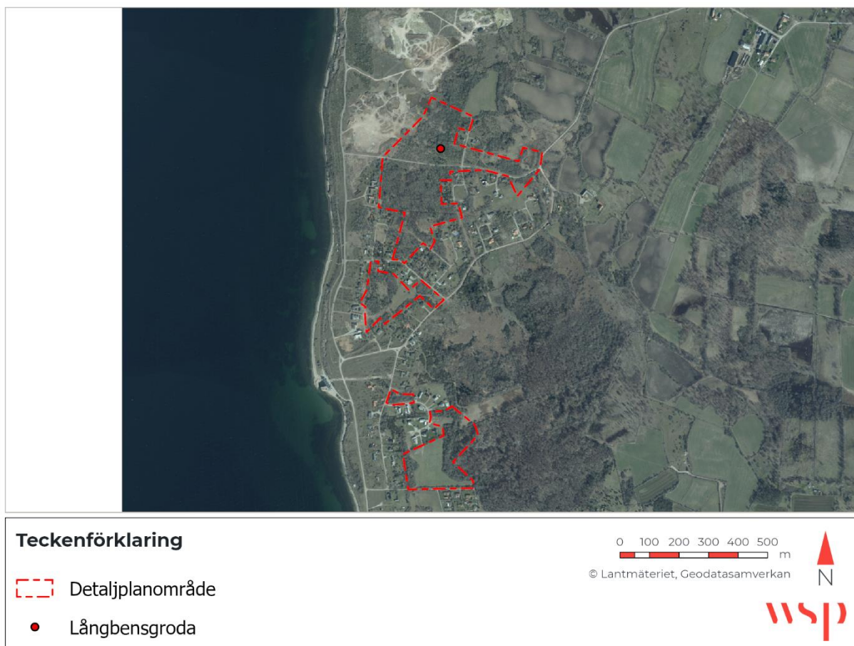
Figur 1. Fynd av långbensgroda rapporterad på Artportalen.

En sökning på Artportalen genomfördes för perioden 2000–2022 efter groddjur inom och kring detaljplanområdet (sökning gjord 2022-02-18). Ett fynd av långbensgroda fanns rapporterad i den norra delen av detaljplanområdet. Från samma område finns långbensgroda noterad från en naturvärdesinventering av området utförd år 2020. Då fyndet är rapporterad av samma person som utförde naturvärdesinventeringen bedöms detta vara samma fynd.