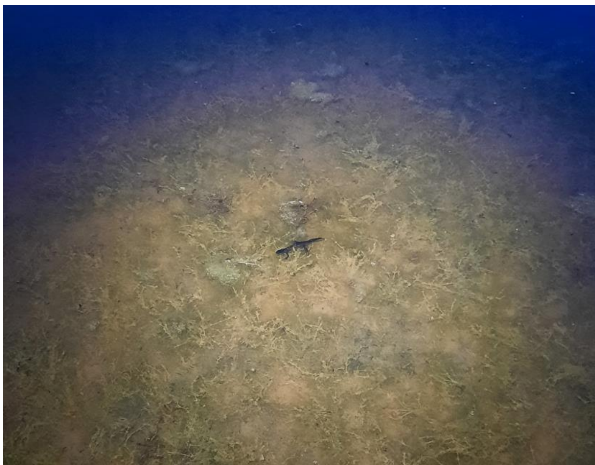
Figur 6. Större vattensalamander i vattensamling 3.

Vattensamling 3 ligger precis intill vattensamling 2. Den är grundare, har mindre växtlighet och omges helt av stenrester jämfört med vattensamling 2. En vuxen större vattensalamander noterades i vattensamlingen vid besöket den 17 maj (figur 6). Mellan varje besök var vattennivån i vattensamlingen likadan, även vid besöket i maj. Vid visiten den 7 juni var dock vattenståndet betydligt lägre.