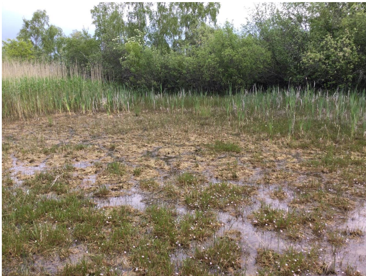
Figur 4. Vattensamling 1 vid besöket den 17 maj 2022.

Vattensamlingen utgörs av ett mindre vatten som är relativt grunt. Vattnet omges av vass i norr, en buskmark i öster och söder och en täkt i väster (Figur 4). Vattnet omges av reststen från täkten. Vid besöket den 10 mars var vattenståndet relativt högt, den 5 april något lägre och den 17 maj ännu lägre. Rom av långbensgroda noterades i vattnet på två platser den 5 april. Vattensamlingen besöktes även den 7 juni i sammanhanget av ett annat uppdrag på samma plats och vattensamlingen var då helt uttorkad. Inga yngel av långbensgroda noterades varken i maj eller juni.