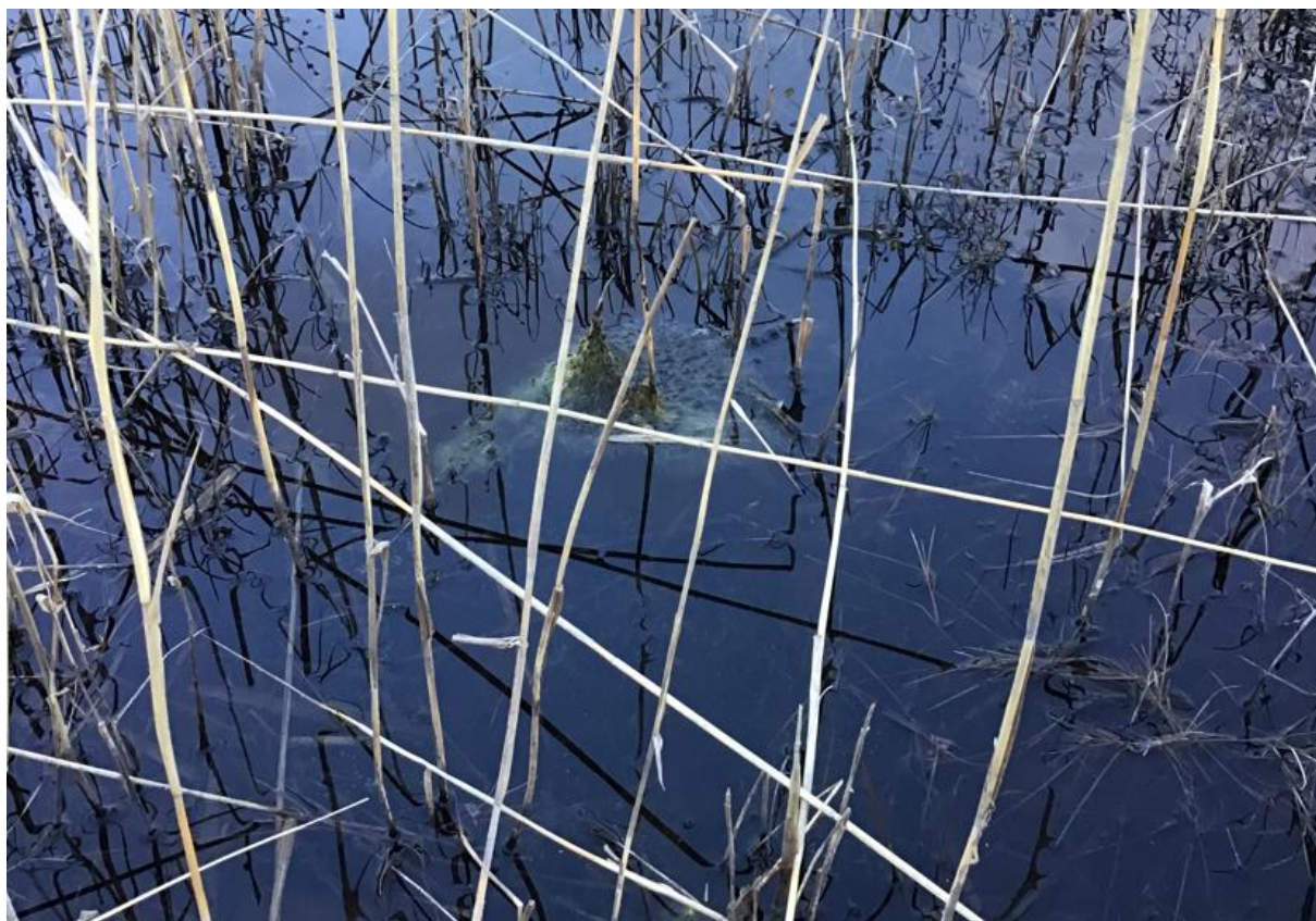
Figur 5. Långbensgroderom i vattensamling 2 vid besöket den 5 april.

Vattensamling 2 utgörs av två ihopkopplade grunda vattensamlingar, med ett tätare vassbälte mellan. Vattenväxtlighet förekommer rikligt i vattnet. Vattensamlingen omges nästan helt av tälten, med en del av buskmarken i söder. Rom av långbensgroda noterades på två platser vid besöket den 5 april (Figur 5). En oidentifierad salamander noterades simma snabbt förbi i vattnet vid besöket den 17 maj. Vattenståndet var precis som vattensamling 1 konsekvent nedåtgående mellan varje besök, och var vid ett besök den 7 juni helt uttorkad. Inga yngel av långbensgroda noterades varken i maj eller juni.